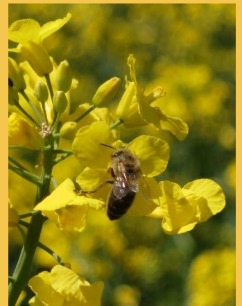
CSÁKI SZABOLCS termelő Nagyhegyes

Egyöntetűség, robosztus habitus, számtalan elágazás, kiváló növényegészség állomány szinten. Illetve idén tábla szinten 1,8 - helyenként 2 méteres növénymagasság, kimagasló hozam ígéretével.