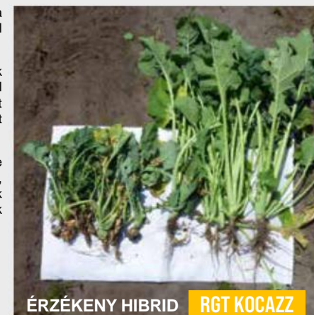
ÉRZÉKENY HIBRID RGT KOCAZZ